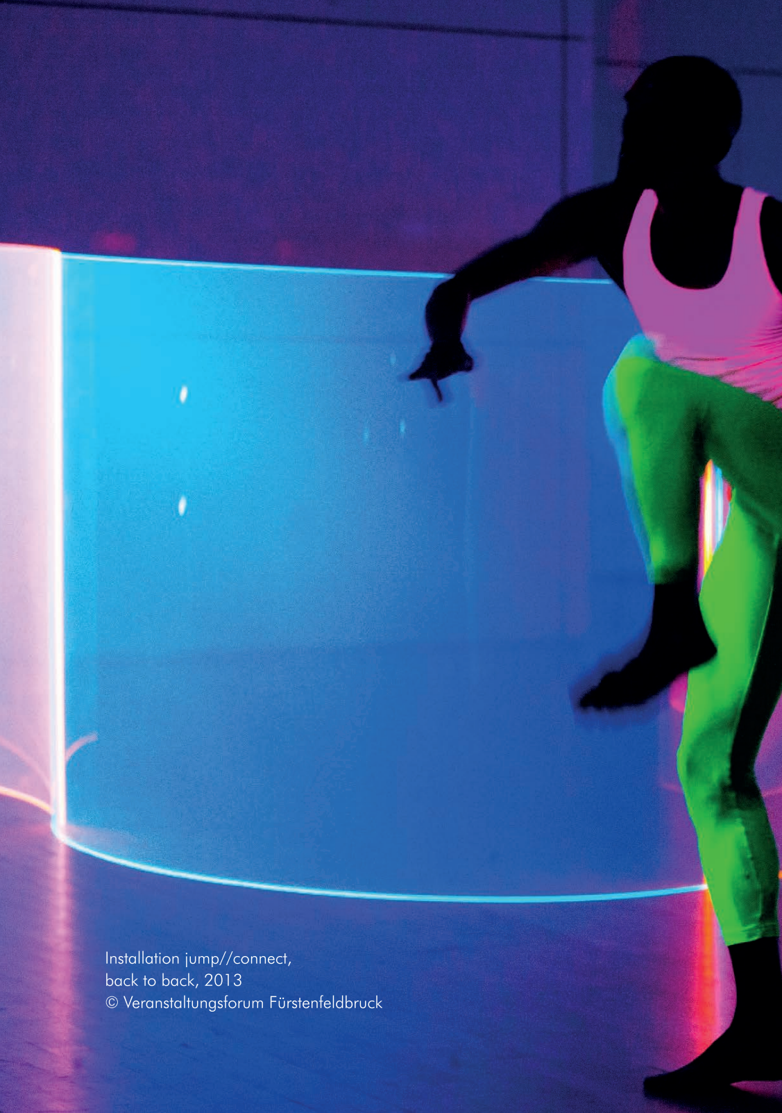
Installation jump//connect, back to back, 2013