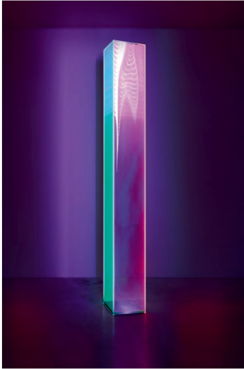
Tower Cologne, 2014 Acrylglas, fluoreszierend 240 x 40 x 30 cm Links: im Schwarzlicht