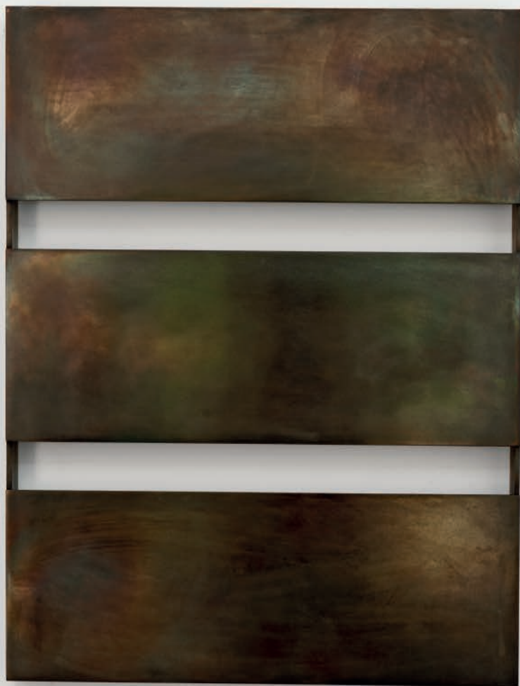
VOID XXXVII 2019 Gebrannter Stahl 70 x 53 x 5,5 cm