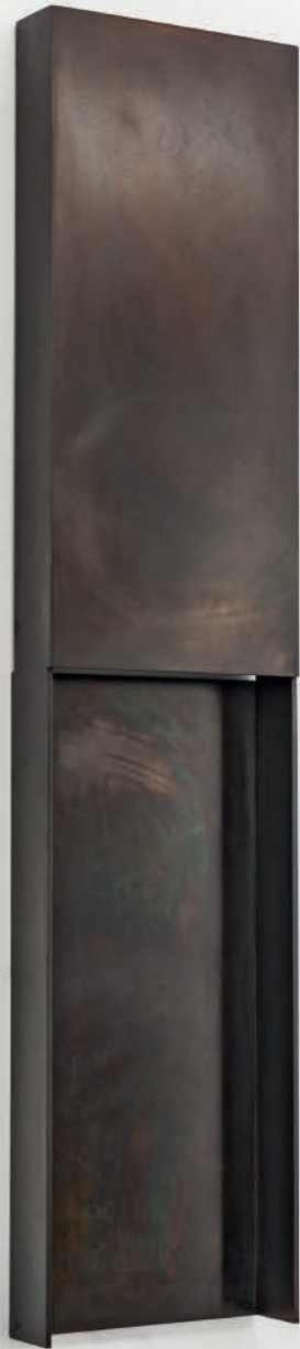
VOID XXXIV 2020 Gebranter Stahl 116 x 26 x 8 cm