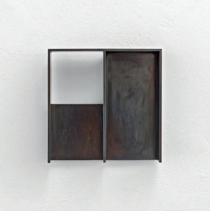
Infinite Void 2020 Gebrannter Stahl 17,6 x 17,6 x 4,4 cm Edition: 20 Exemplare