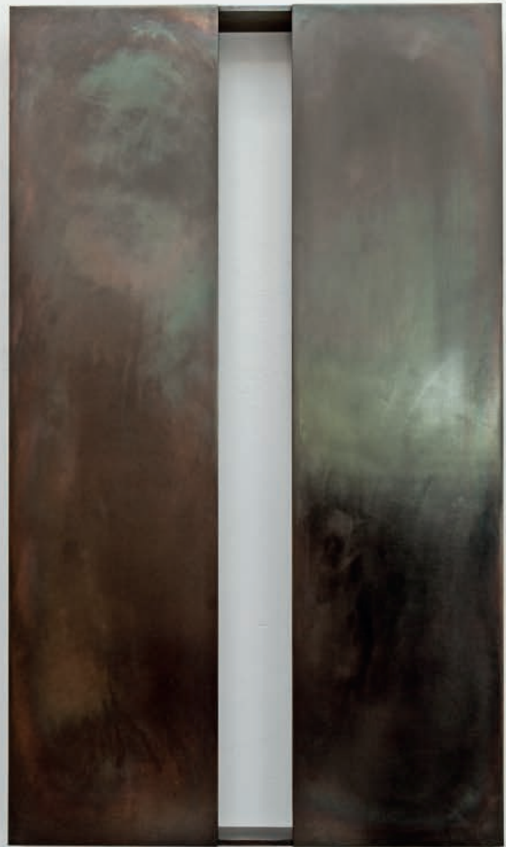
VOID XXXX 2019 Gebrannter Stahl 80 x 47 x 7,5 cm