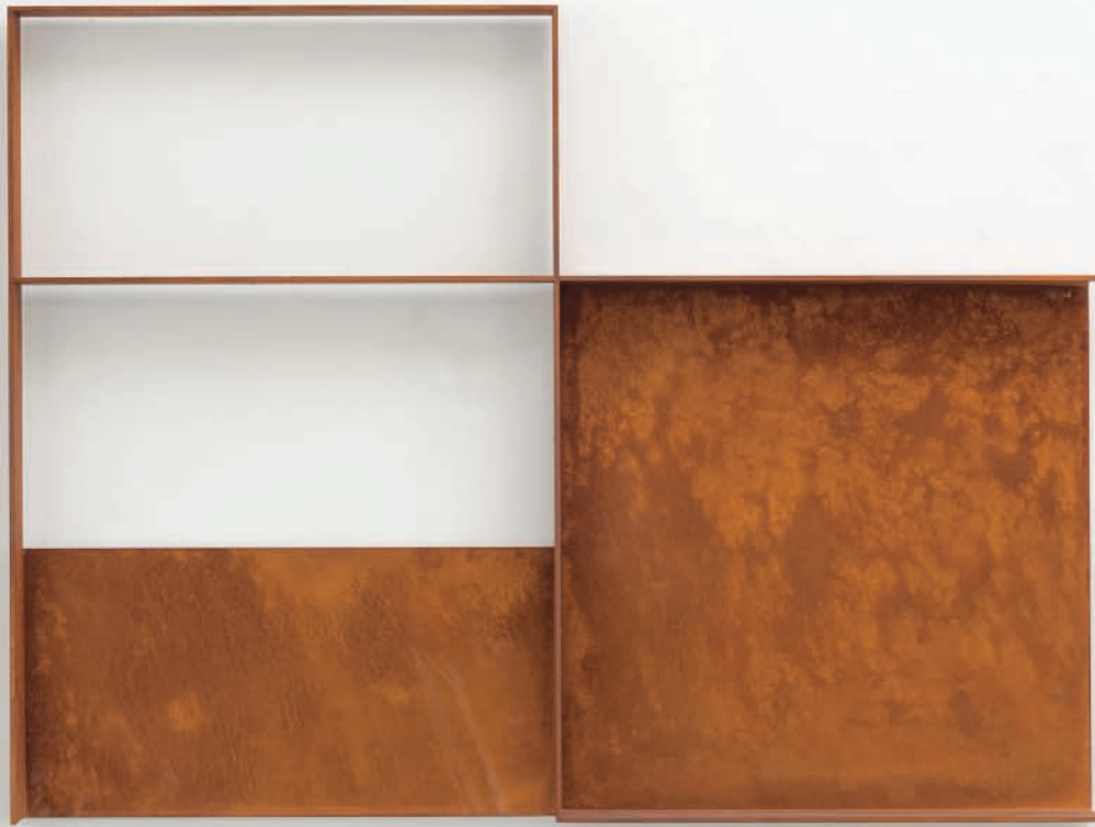
VOID XXXVII 2020 Stahl mit Rostpatina 94,5 x 126 x 6,5 cm