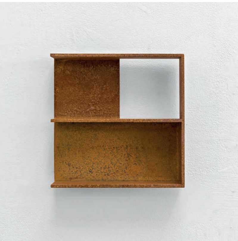
Infinite Void 2020 Stahl mit Rostpatina 17,6 x 17,6 x 4,4 cm Edition: 20 Exemplare